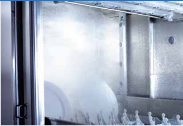
Trysky v mycím stroji musí oplachovat správně uložené nádoby všude.