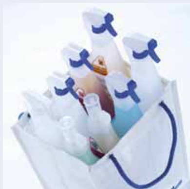
Ke každé myčce je třeba speciálních mycích prostředků.

Vrcholnou formou kontroly je pak hygienický audit, který posuzuje provoz velmi komplexně. Na gastronomické zařízení se dívá z hlediska dodržování platné legislativy související s provozováním stravovací služby. Posuzuje úroveň uplatňování zásad SHVP a dodržování výrobních postupů s uplatněním technologických a hygienických pravidel. Má-li provozovna zaveden systém HACCP, sleduje jeho úroveň a funkčnost. Velká pozornost je věnována personálu z hlediska plnění jeho povinností