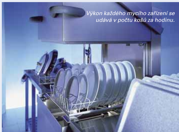
Výkon každého mycího zařízení se udává v počtu košů za hodinu.

Dochází k úsporám surovin, energií a dalších zdrojů. Omezují se ekonomické ztráty vzniklé při označování, přesnosti plnění či vážení. A v neposlední řadě se zvyšuje důvěra veřejnosti a státních kontrolních orgánů.