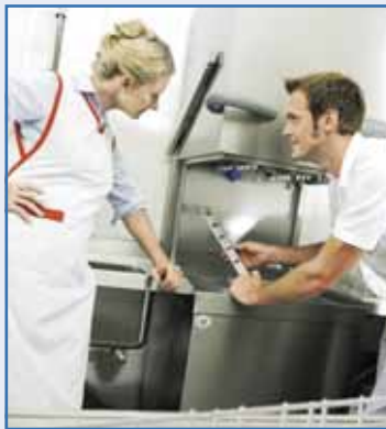
Kontrolovat mycí zařízení by se měla minimálně jednou ročně.

Při koupi byste se měli zajímat o mycí stroj, který splní veškeré požadavky, vyřeší problémy se špinavým nádobím či sklenicemi a zjednoduší oběh nádobí. Současně je nutné dbát na technické vlastnosti stroje, jeho charakteristiky a parametry. Kromě spotřeby vody a energie, je důležitý výkon. Ten se obvykle uvádí v koších za hodinu. Tady je potřeba rozlišovat mezi teoretickým výkonem a praktickým, který zahrnuje dobu nutnou na vyndání koše s umytým nádobím a zandáním koše s použitým nádobím. U kontinuálních myček se koeficient blíží číslu jedna, u ostatních by se měl pohybovat v rozmezí 0,6 až 0,8. Je dobré porovnat si také data mezi jednotlivými značkami a to nejen na papíře, ale i ve skutečnosti. Ideální je