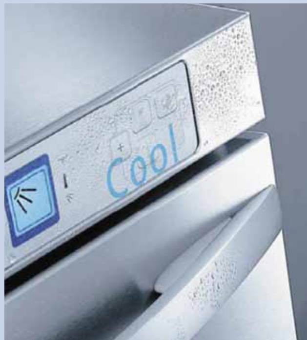
Z myčky Winterhalter GS 200 Cool se vyndává vychlazené sklo.

A v praxi? Myčka zchladí sklenice natolik, že teplota piva zůstane (při teplotě přírodní vody 18 °C a teplotě točeného piva 4 °C) vždy pod maximálním limitem 5,8 °C, což zajistí jeho dokonalou chuť a říz.