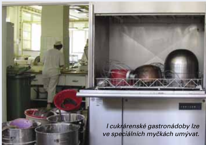
I cukrárenské gastronomické kuchyně lze ve speciálních myčkách umývat.

Zavedení systému HACCP přináší řadu výhod. Garantuje stálost výrobního procesu a tím i stabilní a vysokou kvalitu poskytovaných služeb a produktů zákazníkům. Zkvalitňuje systémy řízení a zdokonaluje organizační struktury dané společností. Jeho zavedením se docílí optimalizace nákladů. Snižují se provozní náklady a náklady na neshodné výrobky.